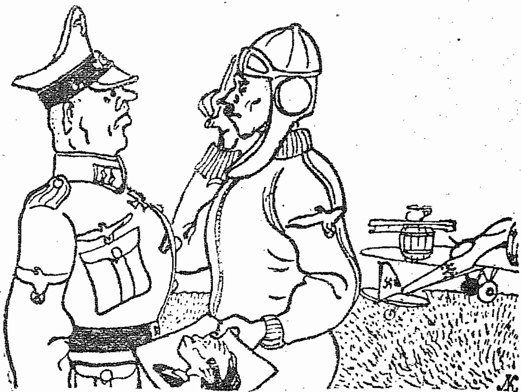
Рисунок Л. КАПЛАНА.

НЕМЕЦКИЙ ПИЛОТ: Разрешите доложить, господин обер-лейтенант, бомбардировщик готов к вылету. На самолет погружены две «взвонные» бочки, три «нюющих» горшка, четыре «лающих» рельсы и прочая рухлядь. Думаю заодно сбросить и портрет господина Геббельса. Только один Геббельс сможет соврать, что это настоящие бомбы.